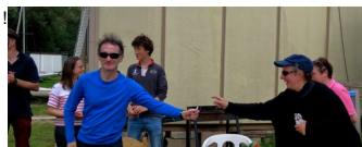
2ème au classement général